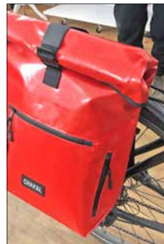
Chakal-Tasche am Fahrrad

www.chakal.de, Verkauf auch in der montagehalle-berlin, Togostraße 79a, 13351 Berlin