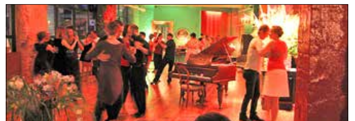
Im Tangoloft kann man in das neue Jahr hinein tanzen. Es wird allerdings die letzte Silvesterparty sein.

Eine Besonderheit ist das Mitbring-Buffer – jeder soll etwas beisteuern. Doch auch die Köche des Lofts werden dafür sorgen, dass immer Nachschub da ist. Das Tangoloft spendiert einen Mitternachtssekt, aber auch all die anderen Silvester-Kleinigkeiten wie Knallbonbons und Wunderkerzen werden nicht fehlen. Im Eintrittspreis von 46 Euro sind alle Softdrinks und Cocktails inklusive. Wer etwas fürs Mitbringbuffet beisteuert, braucht nur 36 Euro Eintritt zu zahlen. Wie die Veranstalterin auf Facebook mitteilt, kann man jederzeit auch ohne Anmeldung spontan zur Silvesterparty gehen. Kontakt: mona-isabelle@tangoloft-berlin.de dh