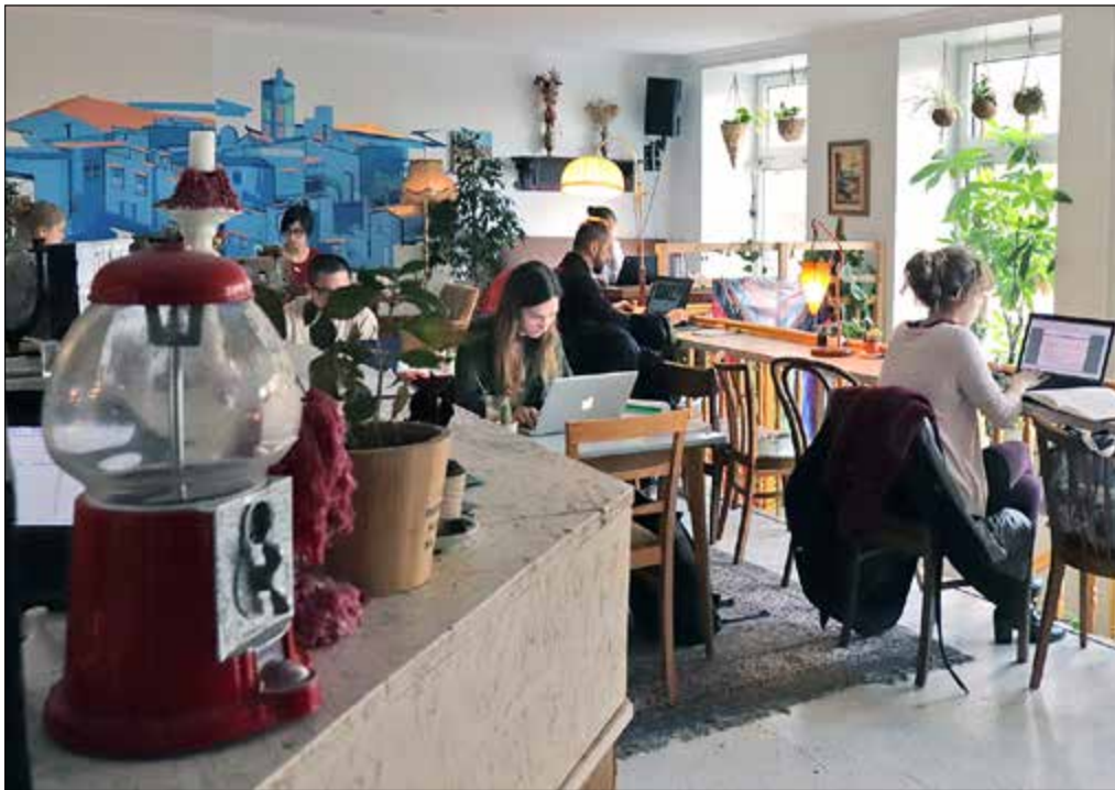
Blick ins be'kech in der Exerzierstraße. Hier kann man coworken, es gibt aber auch viel Kultur.

Wer möchte, kann sein Essen mitbringen. Das macht jedoch niemand, denn in den fünf Cent pro Minute sind ein ständig wechselndes vegetarisches Buffet sowie nicht al-