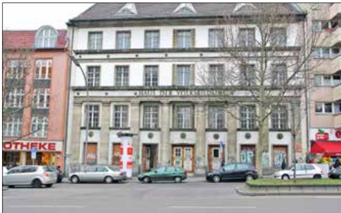
Neu eröffnet: das Sprachförderzentrum in der Badstraße

Nach zehn Jahren in Moabit ist das Sprachförderzentrum Mitte im November in der Badstraße 10 neu eröffnet worden. Das Zentrum wird als Kooperation des Bezirks und der Senatsverwaltung für Bildung, Jugend und Familie nun im ehemaligen Haus der Volksbildung betrieben, das zuvor renoviert wurde.