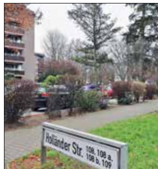
Hier wird aufgestockt und nachverdichtet.

Eine Zielvereinbarung zwischen dem Bezirk Mitte und dem Berliner Senat vom Februar 2018 spricht von 7.346 neuen Wohnungen durch „Nachverdichtung“. Genannt wird dort zum Beispiel ein Teil des Johannes-Evangelist-Friedhofes in der Holländer Straße. Platz für 300 Wohnungen sei dort. In der Triftstraße könne eine Hochgarage abgerissen werden. as