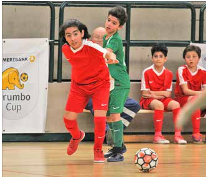
Packende Zweikämpfe sind bei Fußball-Spielen in der Halle beinahe im Sekundentakt geboten.

46. Commerzbank Drumbo Cup ist in vollem Gange – Bezirksfinale am 13. Januar, Endrunde steigt im März