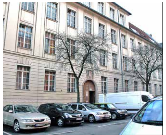
Alte Schule in der Gotenburger Straße als ein Haus der Hilfe?