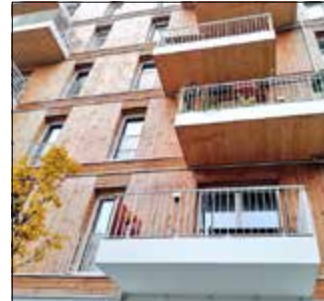
Fassade aus Holz.

Erstmals hat das Land den Berliner Holzbaupreis verliehen. Ausgezeichnet wurden im Oktober sechs Projekte. In der Kategorie Neubau erhielt auch das Holzhaus in der Lynarstraße 38 als innovativer, ökologischer und nachhaltiger Bau eine Auszeichnung. 58 Projekte waren in den Kategorien Neubau, Bauen im Bestand und Konzepte eingereicht worden, die in den vergangenen 15 Jahren in Berlin realisiert wurden.