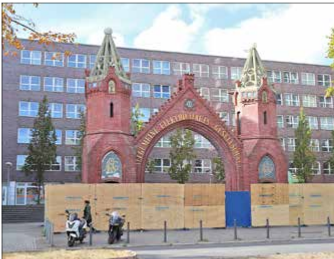
Das historische AEG-Tor in der Brunnenstraße ist eingerüstet.

IMMOBILIEN Denkmal bröckelt, Behörde lässt sich Zeit