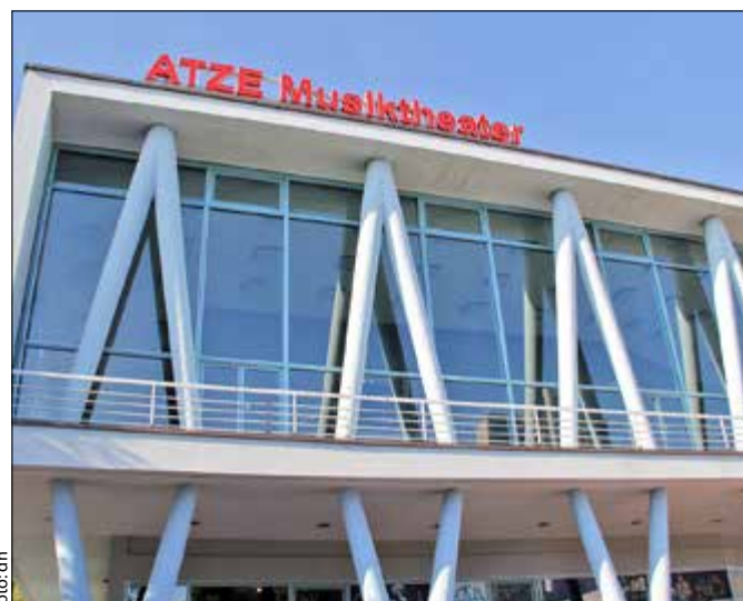
Das Atze Musiktheater – seit Kurzem mit neuem Stück im Spielplan

Das Stück „Albirea“ ist für Kinder ab zehn Jahre geeignet. Spieltermine für Familien oder Schulklassen stehen zunächst bis Juni 2020 fest. Mehr dazu ist auf der Webseite www.atzeberlin.de/albirea zu erfahren. Karten gibt es unter Tel. 81 79 91 88. dh