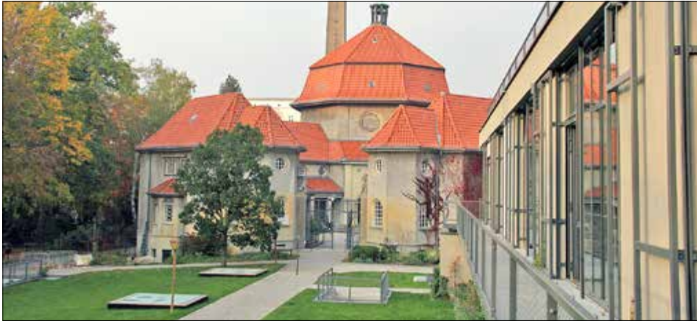
Denkmalpreis für Silent Green

HISTORISCHES Quast-Medaille für vorbildliche Sanierung