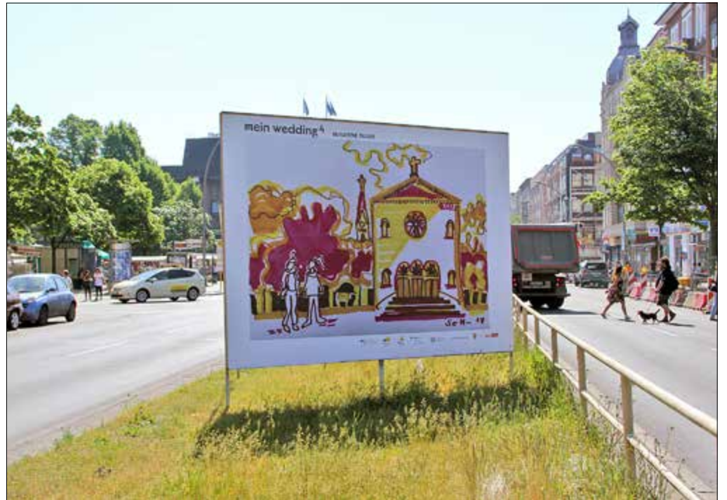
Große Plakatwände mit Kunstwerken – die Freiluftgalerie in der Müllerstraße