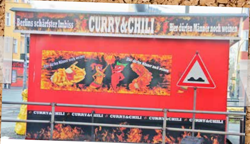
Nichts für Weicheier: An Berlins schärfstem Imbiss an der Osloer Straße/ Ecke Prinzenallee gibt es Gerichte in zwölf Schärfestufen und zehn scharfen Saucen. Hier dürfen Männer noch weinen. Uns kommen die Tränen!

Das Team vom RAZ Verlag wünscht allen Lesern frohe Weihnachten und einen guten Rutsch ins neue Jahr!