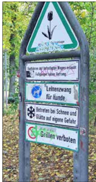
Die Regeln für die Benutzung des Schillerparks stehen unter anderem am Eingang des Schillerparks.

Vor allem Hundehalter wurden von diesem Pilotprojekt angesprochen