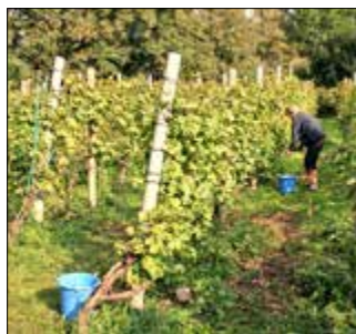
Wein im Humboldthain.

In diesem Jahr ist die Weinlese im Volkspark Humboldthain ausgefallen. Das Straßen- und Grünflächenamt hatte die mehr als 30 Jahre alten Reben im Frühjahr durch neue ersetzt. Die alten Pflanzen waren durch Krank-