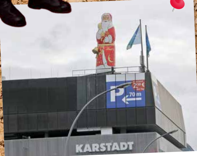
Über den Wedding wachte in der Vorweihnachtszeit ein übergroßer Weihnachtsmann. Vom Dach des Karstadt am Leopoldplatz schaute er über den Stadtteil.