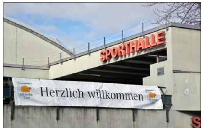
Hier wollen alle hin: Die Finalrunde findet in der Sporthalle Charlottenburg statt.