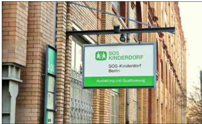
SOS-Kinderdorf in den Osrathhöfen hilft jungen Flüchtlingen

WIRTSCHAFT SOS-Kinderdorf ebnet geflüchteten Jugendlichen den Weg zum Job