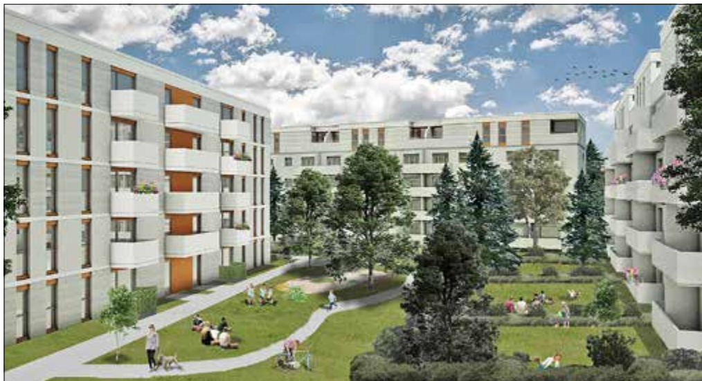
Visualisierung der Aufstockung im Kiez Schillerhöhe