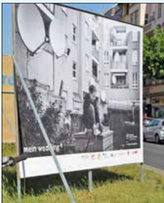
Kunst auf dem Mittelstreifen der Müllerstraße

Die Standortgemeinschaft Müllerstraße e.V. existiert seit 2013, derzeit sind 25 Unternehmer Mitglied im Verein. In Zusammenarbeit mit dem Geschäftsstraßenmanagement hat der Verein in der Vergangenheit mit verschiedenen Angeboten und Aktionen versucht, die Händler in der Müllerstraße zu unterstützen. Auf der Haben-Seite der Vereinsarbeit stand ein monatliches Händlerfrühstück. Es gab Workshops zur Schaufensterdekoration und zu Social Media. Es wurden Willkommenstüten für Neu-Weddinger verteilt, es gab so genannte Dinner en blanc (weiße Dinner) im Umfeld der Müllerstraße. Darüber hinaus waren da viele Publikationen und Kampagnen sowie die jährliche Freiluftausstellung auf dem Mittelstreifen der Müllerstraße. Außerdem konnten Gewerbetreibende finanzielle Unterstützung erhalten, zum Beispiel für neue Möblierung oder eine Markise.