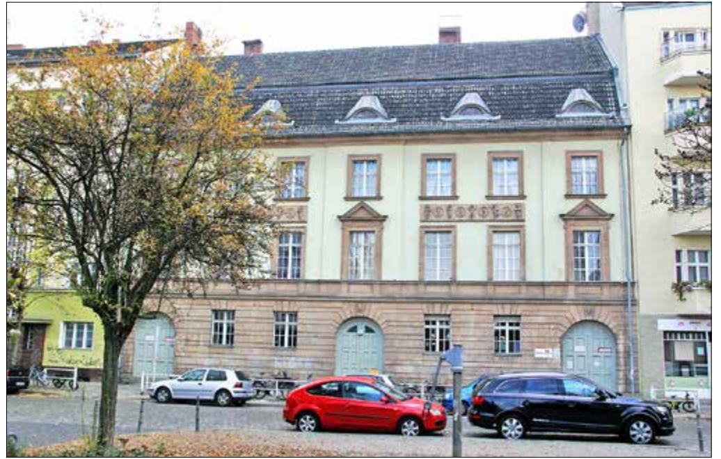
Die Sanierung der Carl-Kraemer-Grundschule verschiebt sich.

Termin, um Bauplanungsunterlagen einzureichen, verstrichen