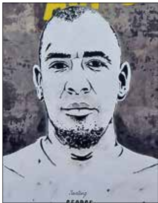
George Boateng

Auf den Bolzplätzen Weddings galt er als der talentierteste Boateng-Bruder: George. Doch während sich seine Geschwister Kevin-Prince und Jérôme zu gut bezahlten Fußballprofis mauserten, landete George im Gefängnis. Während Jérôme wohlbehütet bei dem