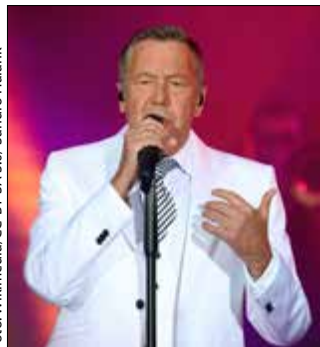
Roland Kaiser

Seine leiblichen Eltern lernte er nie kennen, die Pflegemutter putzte die SPD-Zentrale in der Müllerstraße. Roland Kaiser, Jahrgang 1952, wuchs im Wedding auf und leitete nach seiner kaufmännischen Ausbildung die Werbeabteilung eines Autohauses. Mit seinem Hit „Sieben Fässer Wein“