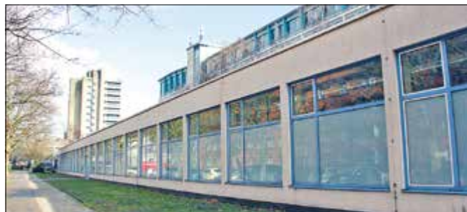
Die Beuth Hochschule für Technik: Sie wird umbenannt.

Die Hochschule für Technik bekommt (irgendwann) einen neuen Namen