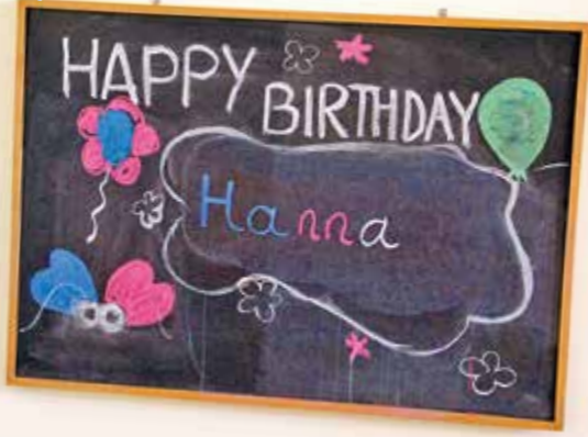
Party im Labyrinth Kindermuseum in der Osloer Straße 12. Wer hier Kindergeburtstag feiert, hat nicht nur die Mitmachausstellung, sondern auch den Geburtstagsraum für die Fete zur Verfügung.