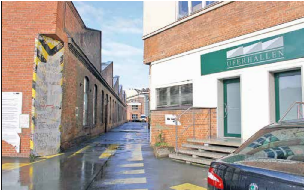
Die Uferhallen, ehemals Betriebshof der BVG, heute etablierter Kulturstandort

Der neue Eigentümer will die Uferhallen sanieren und bauen