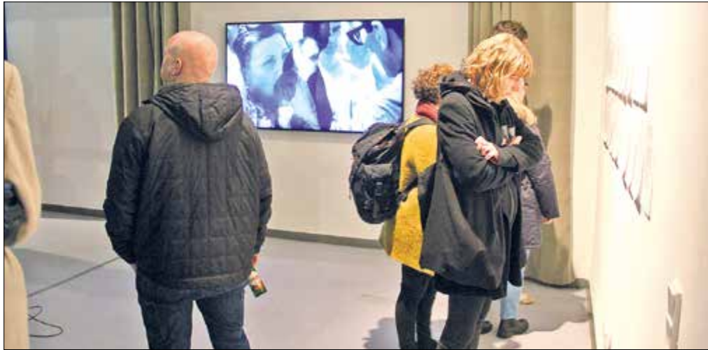
Rechts lesen einige Ausstellungsbesucher in den Antworten der Interviewten, geradezu läuft einer der fünf Filme.

Ausstellung in der kommunalen Galerie in der Müllerstraße