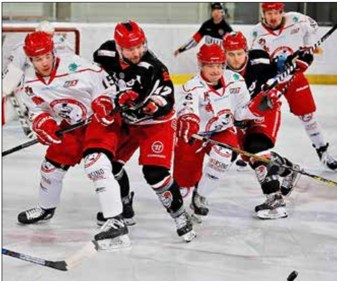
Der gebannte Blick: Da ist er, der Puck, den alle wollen.

Bei FASS hatte sich das Lazarett zumindest soweit gelichtet, dass Headcoach Oliver Miethke drei komplette Blöcke zur Verfügung standen. FASS agierte betont defensiv und setzte auf Konter und Gelegenheiten im Powerplay. So erarbeitete sich der ECC ein optisches Übergewicht, das auch im zweiten Drittel anhielt. Allerdings kam nun auch FASS zu mehr Chancen; die beste vergab Dennis Merk nach 26 Minuten, als er den gegnerischen Keeper