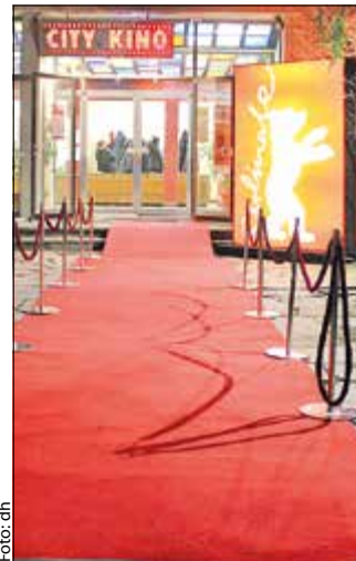
Der rote Teppich für die Berlinale im City Kino Wedding ist ausgerollt.

Wer das Glück hatte, eine der heißbegehrten Berlinale-Karten zu ergattern, der ist vielleicht auch im City Kino Wedding über den fliegenden roten Berlinale-Teppich gelaufen. Zum bereits vierten Mal ist das Programm kino in der Müllerstraße ein Spielort des Filmfestivals. Am 22. Februar hieß es im Centre Francais: Berlinale goes Kiez. Im Rahmen der Reihe wurden zwei Filme gezeigt. Zu sehen war der amerikanisch-kanadische Film „Anne at 13,000