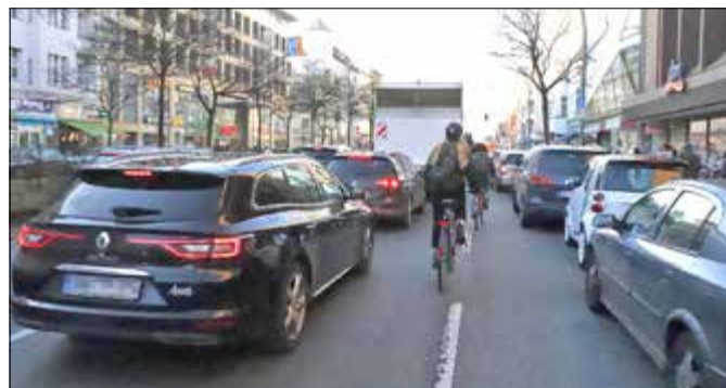
Müllerstraße bisher: drei Spuren für Autos, keine für Räder

Seit Jahren überlegt der Bezirk, wie Radfahrer zwischen die täglich rund 25.000 Autos auf der Müllerstraße eingefädelt werden können. Nun muss der Bezirk seine baufertigen Pläne aus den Jahren 2011 und 2012 überarbeiten. Denn der Senat hat den Bezirk „gebeten“, seine bisherigen Vorstellungen „umzuplanen“, wie es in einer Antwort auf eine Anfrage des Abgeordneten Tobias Schulze (Die Linke) heißt. Grund für Neuplanung ist, dass das Berliner Mobilitätsgesetz aus dem Jahr 2018 „auf allen Hauptverkehrsstraßen Radverkehrsanlagen“ verlangt. Vor allem §43 ist entscheidend: „Die Radverkehrsanlagen sollen so gestaltet werden, dass unzulässiges Befahren und Halten durch Kraftfahrzeuge unterbleibt.“ Dem Senat gingen die ursprünglichen Entwürfe des