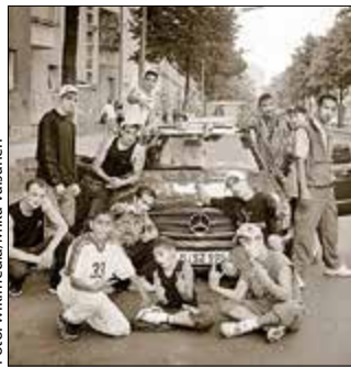
The Flying Steps

1993 gründete Vartan dann die Flying Steps, die mit Shows wie „Flying Bach“ oder „Flying Illusion“ zu einer der erfolgreichsten Urban-Dance-Crews der Welt wurden. Nach jahrelangen Tourneen rund um die Welt kehrten die Breakdancer 2018 mit der Hauptstadthommage „Flying Illusion“ nach Berlin zurück. Das Haus der Jugend am Nauener Platz war dafür aller-