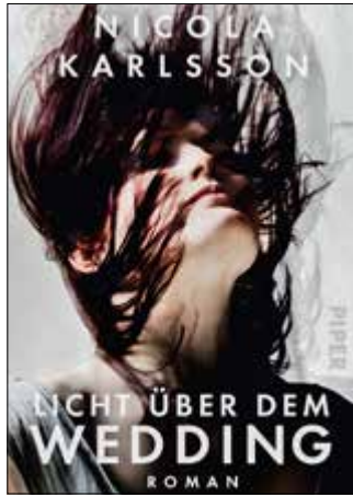
Cover des Romans Licht über dem Wedding von Nicola Karlsson

Die Helden und vor allem die beiden jungen Heldinnen des Romans „Licht über dem Wedding“ von Nicola Karlsson sind keine Lichtgestalten. Beide leben in einem Hochhaus, sprich in einem Sozialwohnungsbau. Beide haben es nicht leicht, wie man gern leichtthin sagt. Der Roman fängt nicht gut an. Es geht los mit einer toten Katze. Und das ist nicht lustig gemeint. Und ohne damit zu viel zu verraten, es geht auch nicht gut aus. Die eine Hauptfigur lebt in prekären Verhältnissen und will vor allem „kein