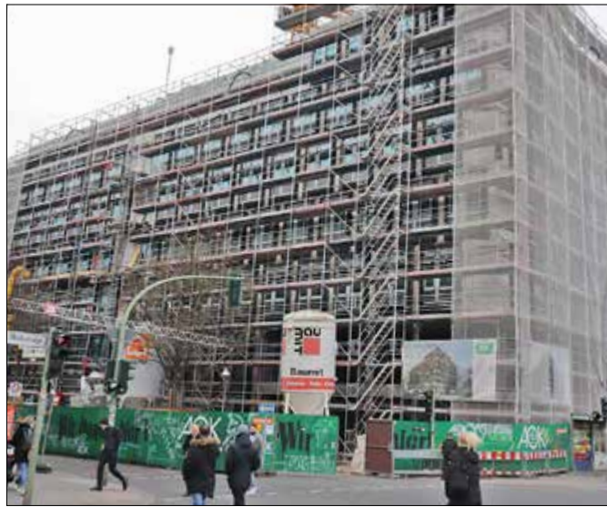
Ärztehaus: ab Herbst exklusiv für AOK-Versicherte

Weiter verspricht er: „Darüber hinaus stellen wir den Versicherten kurzfristige Termine bei fast allen Fachärzten zur Verfügung.“ Die Arztpraxen auf 4.850 Quadratmetern auf sieben Etagen können AOK-Versicherte voraussichtlich ab Herbst 2020 aufsuchen. Der Neubau befindet sich in der Ostender Straße 1 Ecke Müllerstraße direkt neben dem aktuell von der AOK betriebenen Centrum in der Müllerstraße 143. Dessen Abriss ist nicht vorgesehen: „Der Altbau bleibt allein schon wegen der Gewerbemietbestehen“, so die AOK Nordost. Im Neubau wird auch