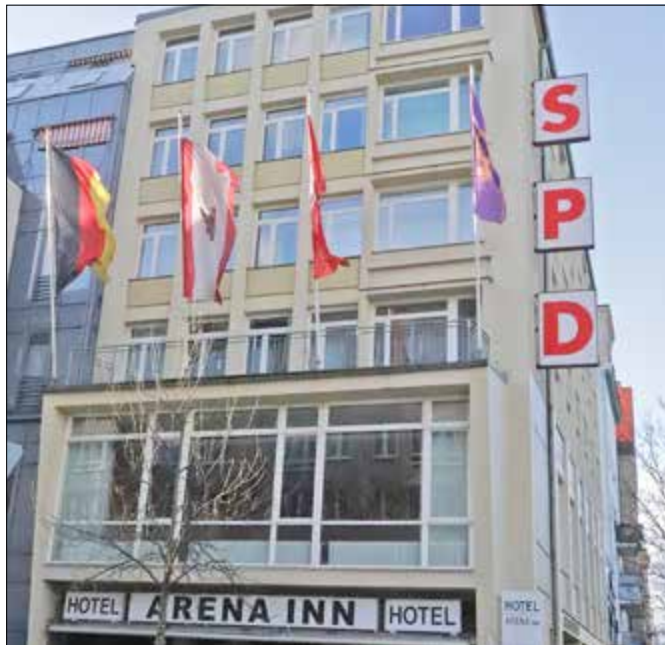
Das Kurt-Schumacher-Haus: erbaut 1960

Etwas versteckt in der Triftstraße wurde 1960 der