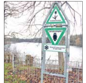
Am Plötzensee gehört noch ein Schild hin: Wildtiere füttern verboten dh

natürlich starke Vermehrung der wild lebenden Tiere befürchtet. Dadurch könne es zu Fäulnisprozessen, Schlammreicherungen, Algenwachstum und sogar zum Umkippen des Gewässers führen, heißt es in der Beschlussvorlage von Bezirksstadträtin Sabine Weißler. Darüber hinaus schade nicht artgerechtes Futter den wild lebenden Tieren und die Reste lockten Mäuse, Ratten und andere Schädlinge an. „Aber auch das gezielte Füttern von anderen wild lebenden Tieren neben den Wasservögeln, wie zum Beispiel Krähen oder Tauben, verursacht Verunreinigungen und hygienische Probleme