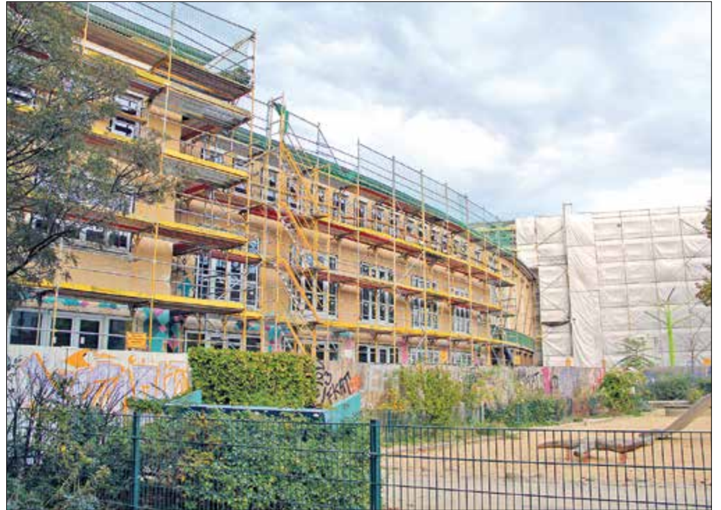
Noch sind die Arbeiten beim Haus der Jugend im vollen Gange.

Kehren im April erste Nutzer an den Nauener Platz zurück?