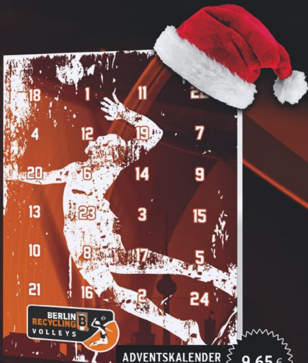
ADVENTSKALENDER SCHOKOLADE INSIDE