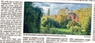
Die Panke-Insel, historisches Wohngebiet am Ostufer des Wannensees.