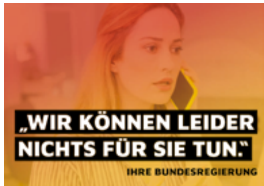
Ein Motiv der Postkartenaktion der Zahnärztekammer Berlin