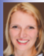
FZP S. Röder